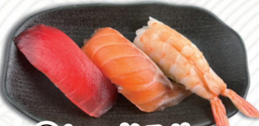
⑩レッドスリー まぐろ・サーモン・蒸し海老 500円(税込550円)