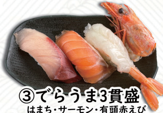
③でらうま3貫盛 はまち・サーモン・有頭赤えび 550円(税込605円)