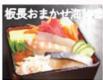
板長おまかせ海鮮