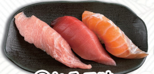
⑬とろ三昧 大トロ・中トロ・とろサーモン 1050円(税込1155円)