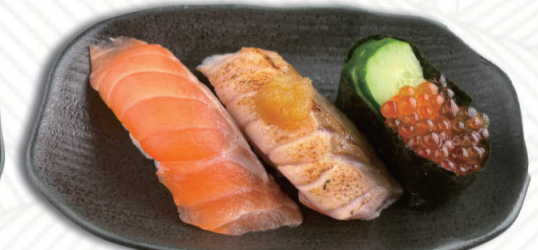
⑥サーモン3種 サーモン・炙りサーモン・いくら 550円(税込605円)