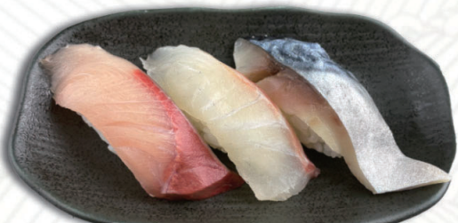
⑦魚河岸3貫 はまち・まだい・メさば 550円(税込605円)