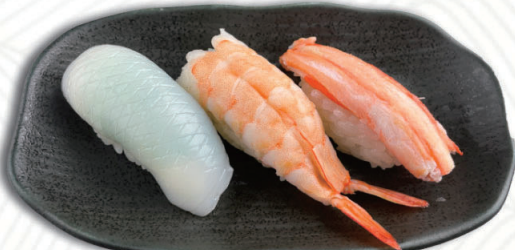
④人気者3種 紋甲いか・蒸し海老・紅ズワイ蟹 500円(税込550円)