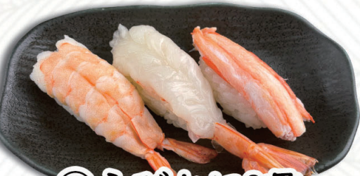
⑭えびかに3貫 蒸し海老・赤海老・紅ズワイ蟹 500円(税込550円)