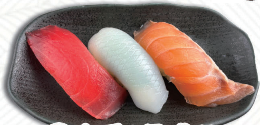
①定番3貫盛り まぐろ・紋甲いか・サーモン 500円(税込550円)