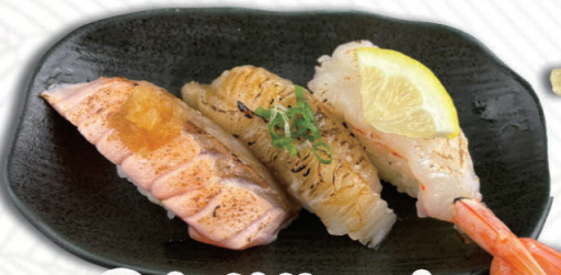
⑧あぶり三昧 サーモン・えんがわ・赤エビ 500円(税込500円)