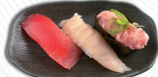
⑤まぐろ3種 漬けまぐろ・びんちょうまぐろ・ねぎとろ 550円(税込605円)