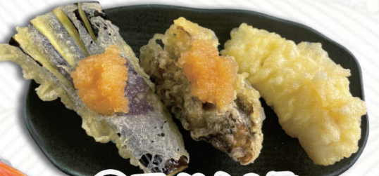
⑨天ぷら3貫 なす・まいたけ・いか 400円(税込440円)