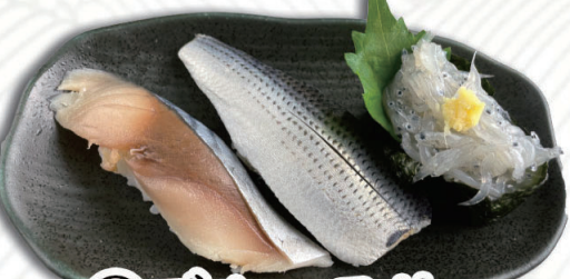
⑪ブルースリー メさば・酢めこはだ・生しらす 400円(税込440円)