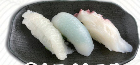
⑫ホワイトスリー えんがわ・紋甲いか・ゆでたこ 450円(税込495円)