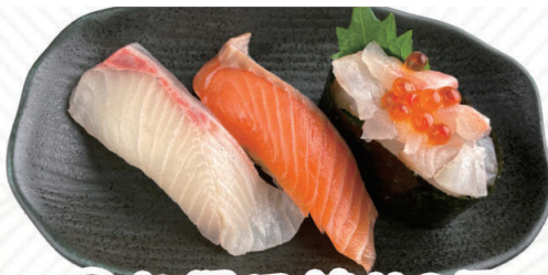
②お得日替り3貫 内容は日替わりです。 500円(税込550円)