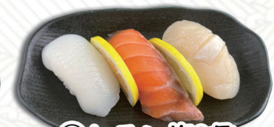
⑮レモン塩3貫 いか・サーモン・ほたて 500円(税込550円)