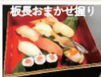
板長おまかせ握り